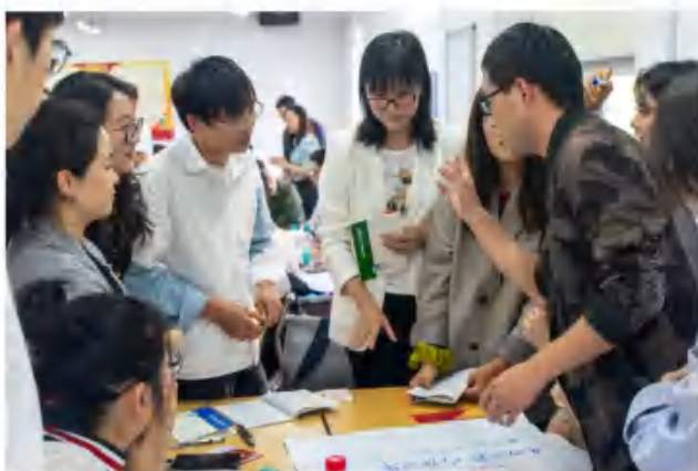
线下培训期间，学员在课堂上进行小组 讨论

针对第一期F.A.I雏鹰、第二期HR雏鹰学员，集团开展实战岗位历练期满考核，通过学员总结自评、导师考核评价、所在企业人力资源部综合评估等方式，对雏鹰学员开展全过程跟踪考核，贯彻落实人才培育闭环机制，为学员育后使用提供参考依据。同时，搭建持续精进的学习平台，组织第一期F.A.I雏鹰学员补充学习中欧“新经理成长营”线上课程，通过转角色、定目标、带团队、赢绩效、促发展五个阶段成长地图，助力专业岗位骨干人才熔炼团队领导力、提升综合职业素能。